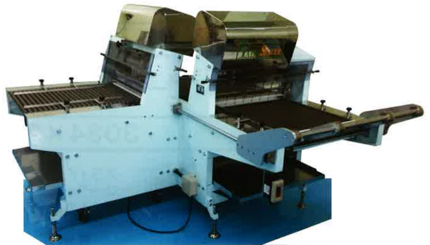
TL-7型(手動タイプ) Manual Type